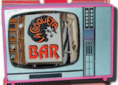
BAR LA CROQUETA

Parece que hoy la norma es conservar arquitectónicamente todo lo anterior a 1950, cuando sin duda la década de los 60-70 fue la más creativa, tendencias vanguardistas y arriegas para su época que ahora otros las ven con la etiqueta de "hortera". Mientras tanto la proliferación de franquicias de todo tipo vetan hoy cualquier intento de inventiva y sorpresa, encontrándonos estéticas que van desde el minimalismo mal entendido al cartón piedra del pub irlandés.