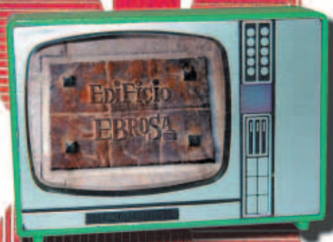
ROTULO DEL EDIFICIO EBROSA